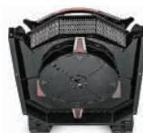
Este estilo de portador de hoja se aplica solo al modelo RS72.