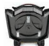
Este estilo de portador de hoja se aplica a los modelos RX72 y RX84.